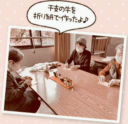
高槻・はにたんコープ委員会

新型コロナ禍の中、生協の新規組合員さんも増えています。「子どもといっしょの買い物が難しくて、重い物だけでも届けてもらっています。」「健康のために散歩はするけど、人がたくさんの中の買い物がちょっと心配で...時短で済ませています。その分、カタログをじっくり見ながら選べる生協で、買い物を楽しんでいます。」などの声が、よどがわ市民生協へ寄せられています。