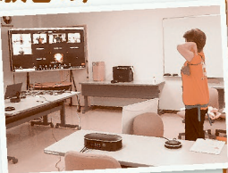
オンラインのようす