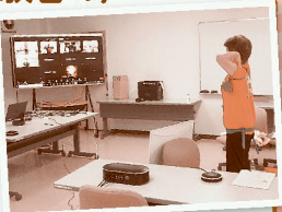
オンラインのようす