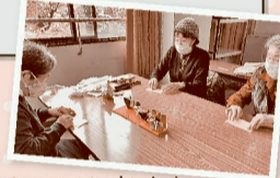
干支(うい)の置き物を折り紙でつくりました♪