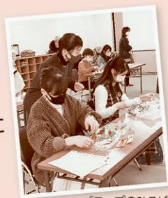
【コープのひろば】のようす