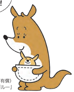
託児スタッフ(有償)「カンガルー」