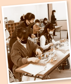
「コープのひろば」のようす