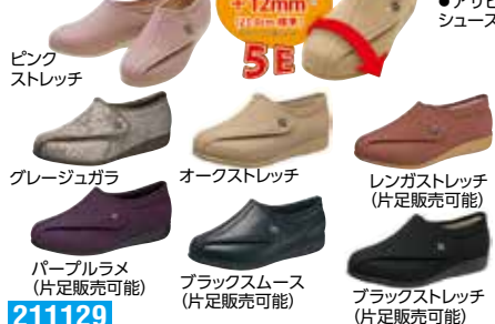
ピンク ストレッチ グレージュガラ オークストレッチ レンガストレッチ (片足販売可能) パープルラメ (片足販売可能) ブラックスムース (片足販売可能) ブラックストレッチ (片足販売可能)