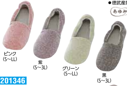
ピンク (S~LL) 紫 (S~3L) グリーン (S~LL) 黒 (S~3L)