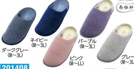
ダークグレー (M~3L) ネイビー (M~3L) パープル (M~3L) ピンク (M~LL) グレー (M~3L)