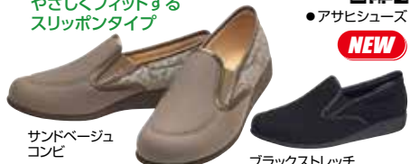
サンドベージュ コンビ