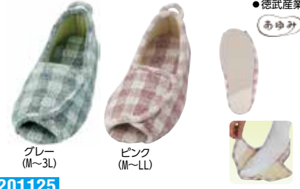
グレー (M~3L) ピンク (M~LL)