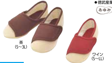
茶 (S~3L) ワイン (S~LL)