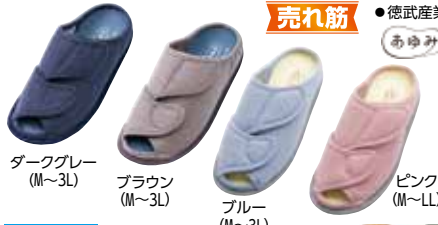
ダークグレー (M~3L) ブラウン (M~3L) ブルー (M~3L) ピンク (M~LL)