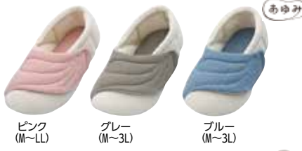
ピンク (M~LL) グレー (M~3L) ブルー (M~3L)