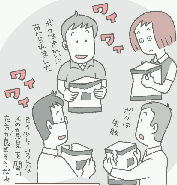
支所での検証風景