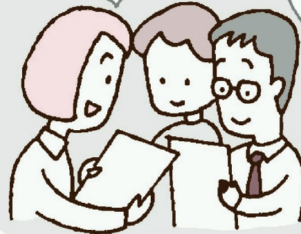
生協の支所で商品を確認