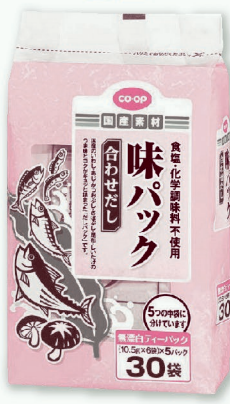
<かつお合わせだし>