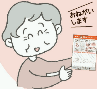
吹田市組合員 Hさん