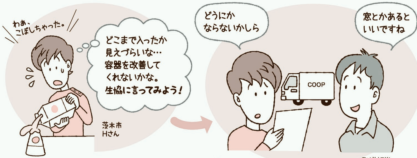
従来の Lalafuwa ボトル (ララフワ)