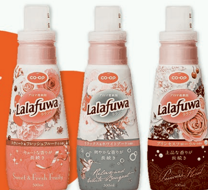
CO・OPアロマ柔軟剤 Lalafuwa(ララフワ)500ml

中身が見えるよう、容器に透明な窓(ビジブルライン)をつけました。あふれるのを防ぐ目安として「つめかえはここまで」のラインも表示しています。