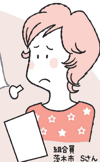
組合員 茨木市 Sさん

ポイント値引きを利用するため計算して 記入したのに、エラーで全く使用されませんでした。 「 使えるポイント＝商品の本体価格 」と どこかに表記されていますか?? これでは他の方も同じようにポイントを使えなくて、困るのではないのでしょうか。