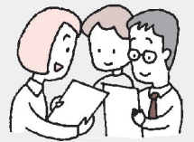
よどがわ生協にて検討