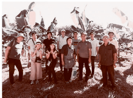
産地訪問の様子をホームページに掲載しています!