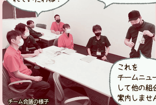
チーム会議の様子