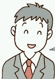
よどがわ商品グループ担当