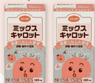
ミックスキャロットミニ 2020年3月より