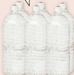
ラベルのない水(あずみ野) 2020年7月より