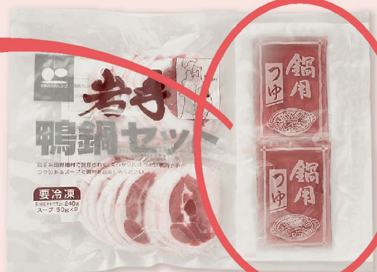
岩手鴨鍋セット 240g+スープ50g×2