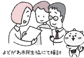
よどがわ市民生協にて検討