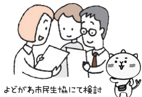
よどがわ市民生協にて検討