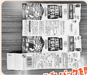
牛乳パックを開いて

生協の袋はどうにかならないかと思うほど、どんどんたまります。夏場、こまめに替えても無くなりません。こうなったら、袋に合わせてみよう、ゴミ箱やプールバッグを思いついた次第です。生協で丁度いいサイズのゴミ箱も見つけました。